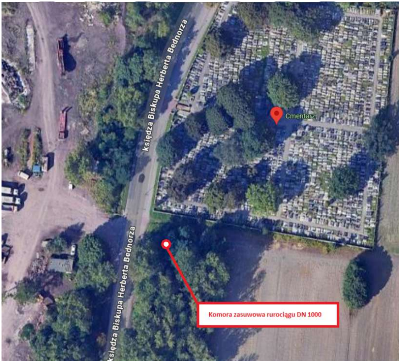
fot.1_Lokalizacja komory zasuwowej DN 1000 (ul. ks. Biskupa Herberta Bednorza w Piekarach Śląskich)