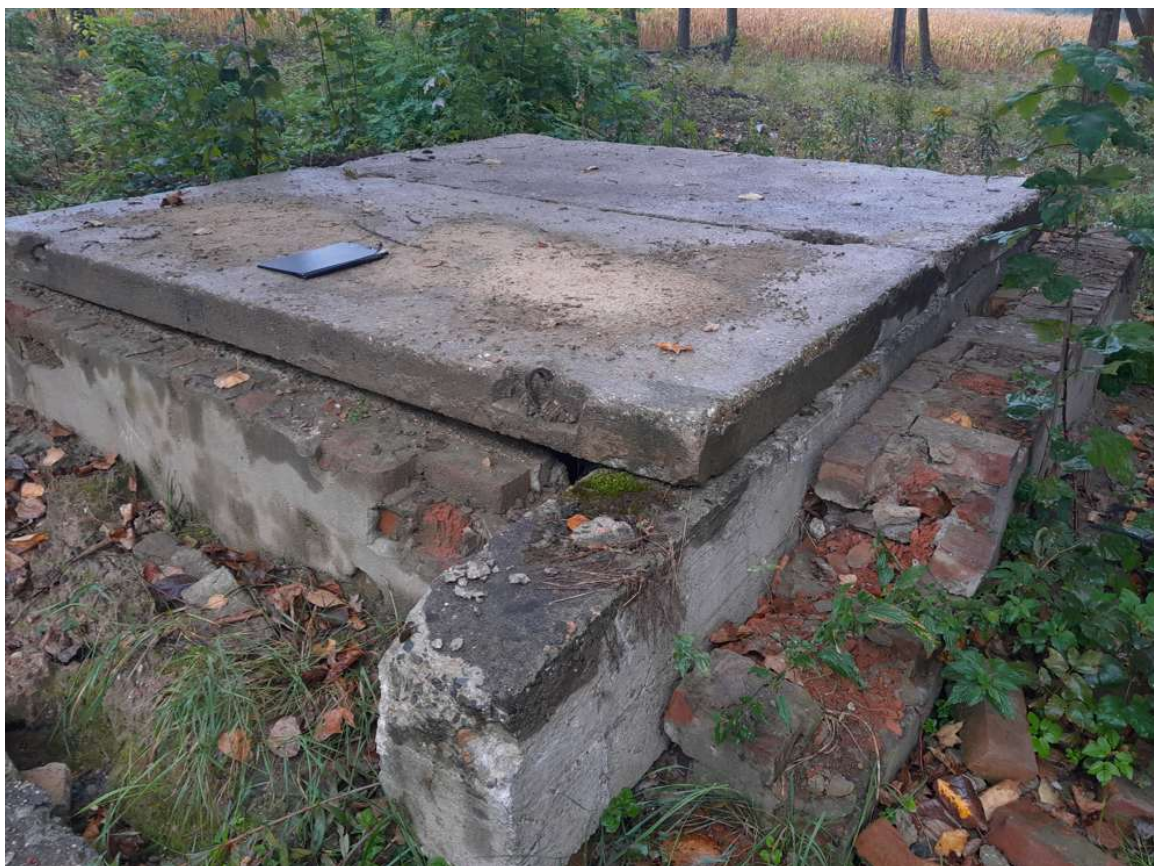
fot.2_Widok na komorę zasuwową